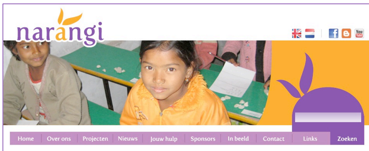
De header van de Narangi website